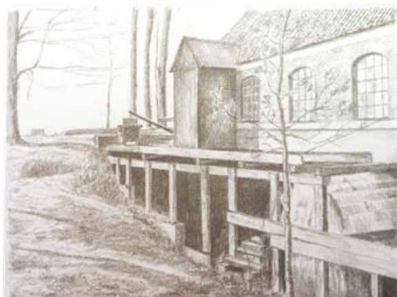
Tekening van de "Rotterdamse Kopermolen" naar foto circa 1890. De molen was toen niet meer in gebruik als kopermolen.